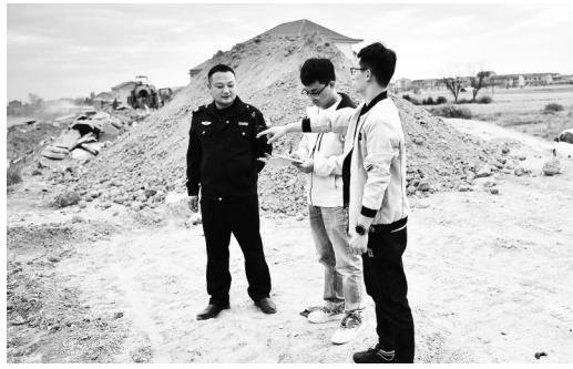
强化水土保持工作巡查监督